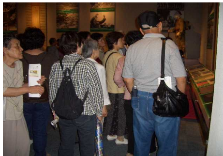
（ ）平和ミュージアム内を見学する参加者の皆さん。ガイドさんの話を熱心に聞いた。「時間がいくらでも足りない」との声も聞かれた

今後のみなと医療生協『九条の会』の予定 8月3日(木)～4日(金) 生協熱田の平和盆踊りに出展 九条茶・缶バッチ・九条ねこバッチなどを販売予定