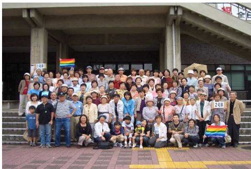
（ ）記念写真を全員で。参加者100名、バス2台のツアーは圧巻の一言

ツアーの感想はこれ以外にもたくさん寄せられましたが、紙面の関係で割愛させていただきます。大変申し訳ありません