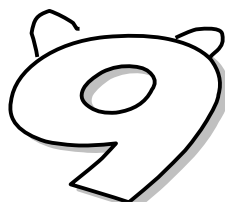
紙粘土で作ったその名も 「九条ねこバッチ」