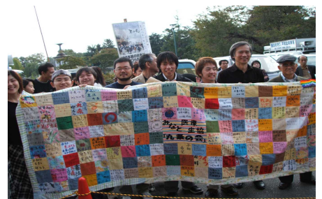
写真上)04年の県民のつどいで、出来立てのタペストリーを披露。注目をあびました。